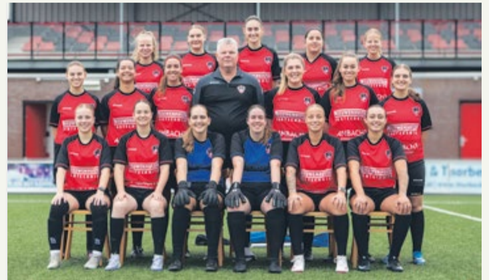
Het uiteindelijke doel van de opleiding is het behalen van Vrouwen 1

Wil jij kennismaken met het voetballen bij IFC? Meld je simpel aan voor proeftrainingen via de website van IFC, www.ifc-ambacht.nl onder het kopje Proeftraining