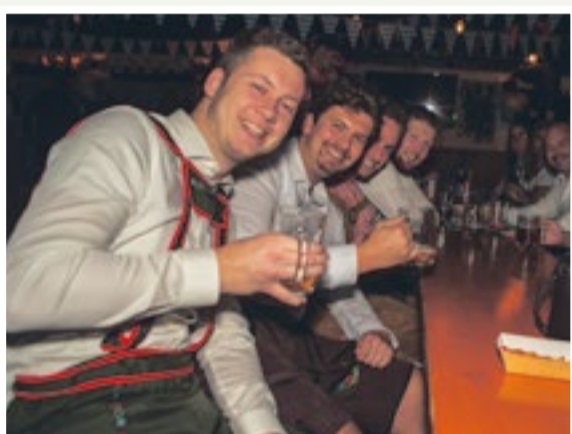
Niet weg te denken: het traditionele "bierfest"