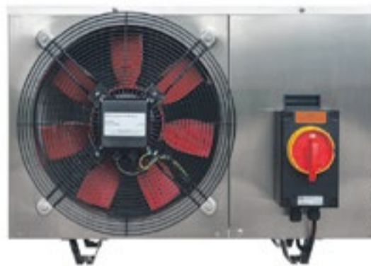
ATEX Marine AC