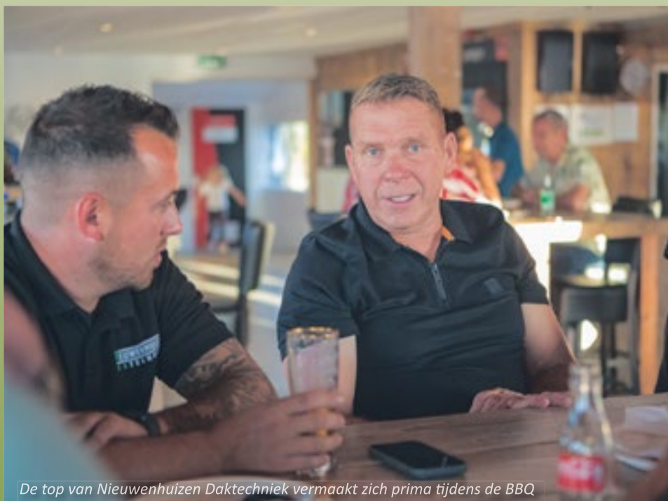
De top van Nieuwenhuizen Daktechniek vermaakt zich prima tijdens de BBQ

Meer weten: info@ibc-ambacht.nl of stuur een mail naar voorzitter@ifc-ambacht.nl