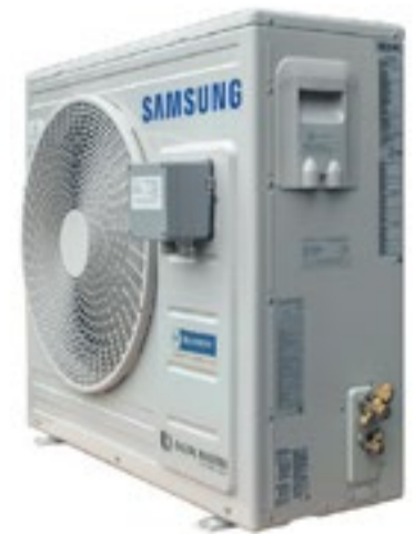
ATEX Industrial AC