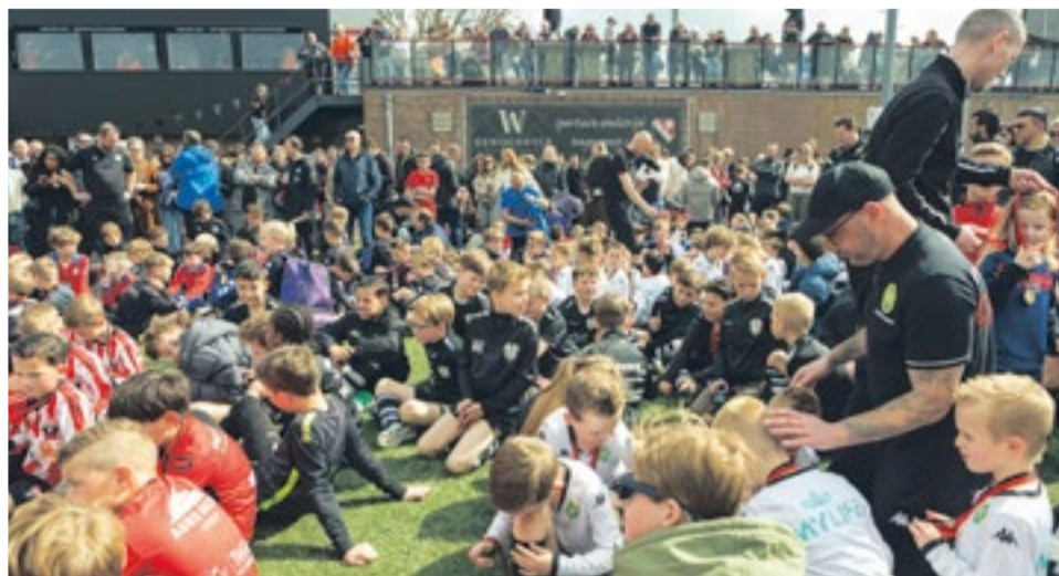
Megadruk, geweldig georganiseerd en fantastische sfeer tijdens het 2-daagse Paastoernooi, inmiddels het paradepaardje van de activiteitencommissie