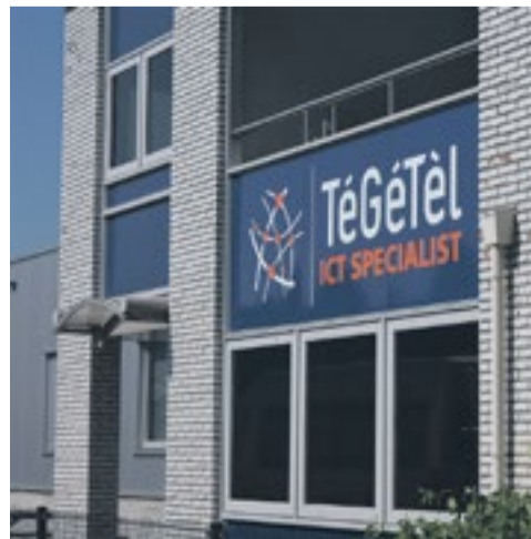
Het fraaie kantoor aan de Stephensonweg 7 in Gorinchem