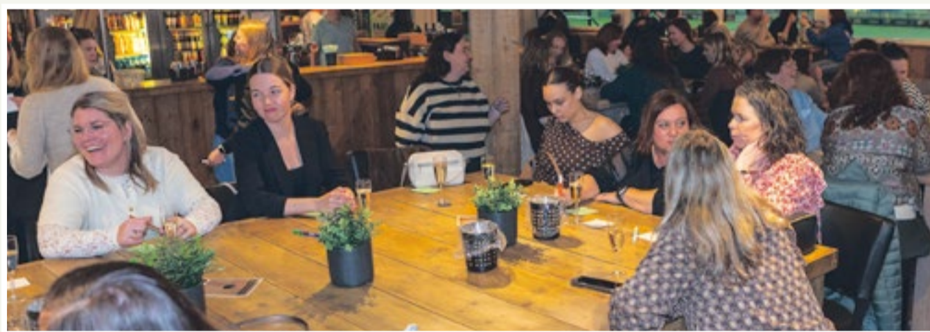
Bingo, oer-Hollands maar blijft gezellig en vermakelijk