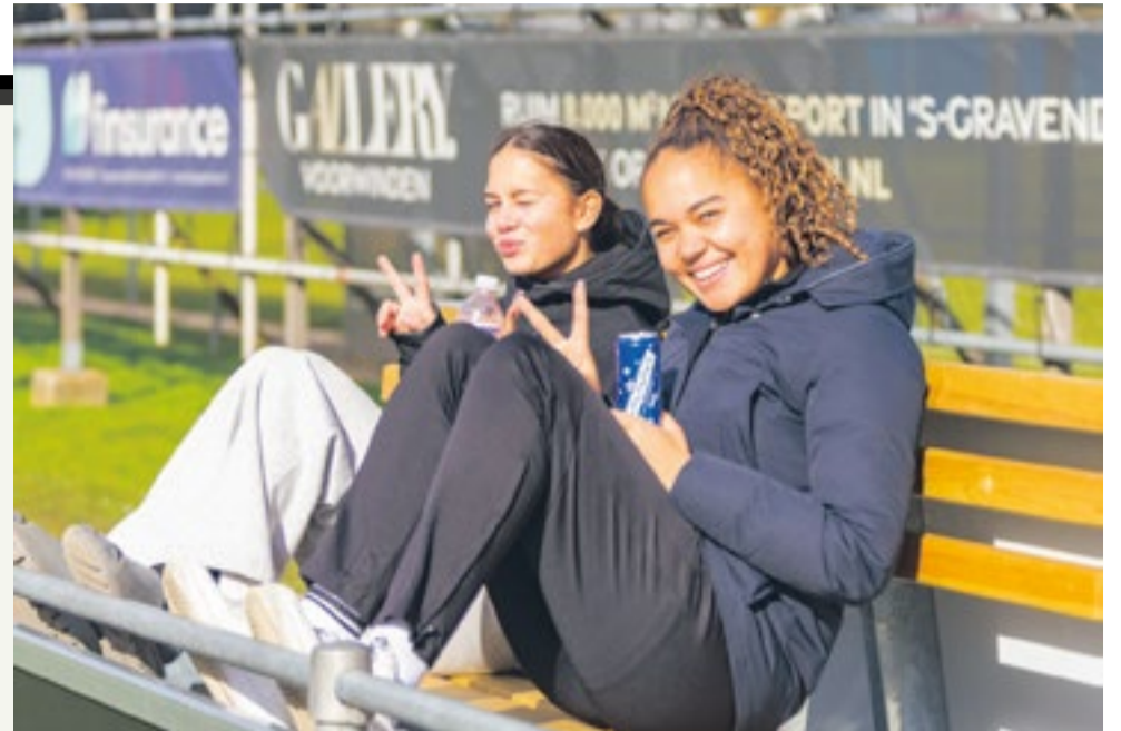
Na een wedstrijd gezellig op het bankje voetbal kijken