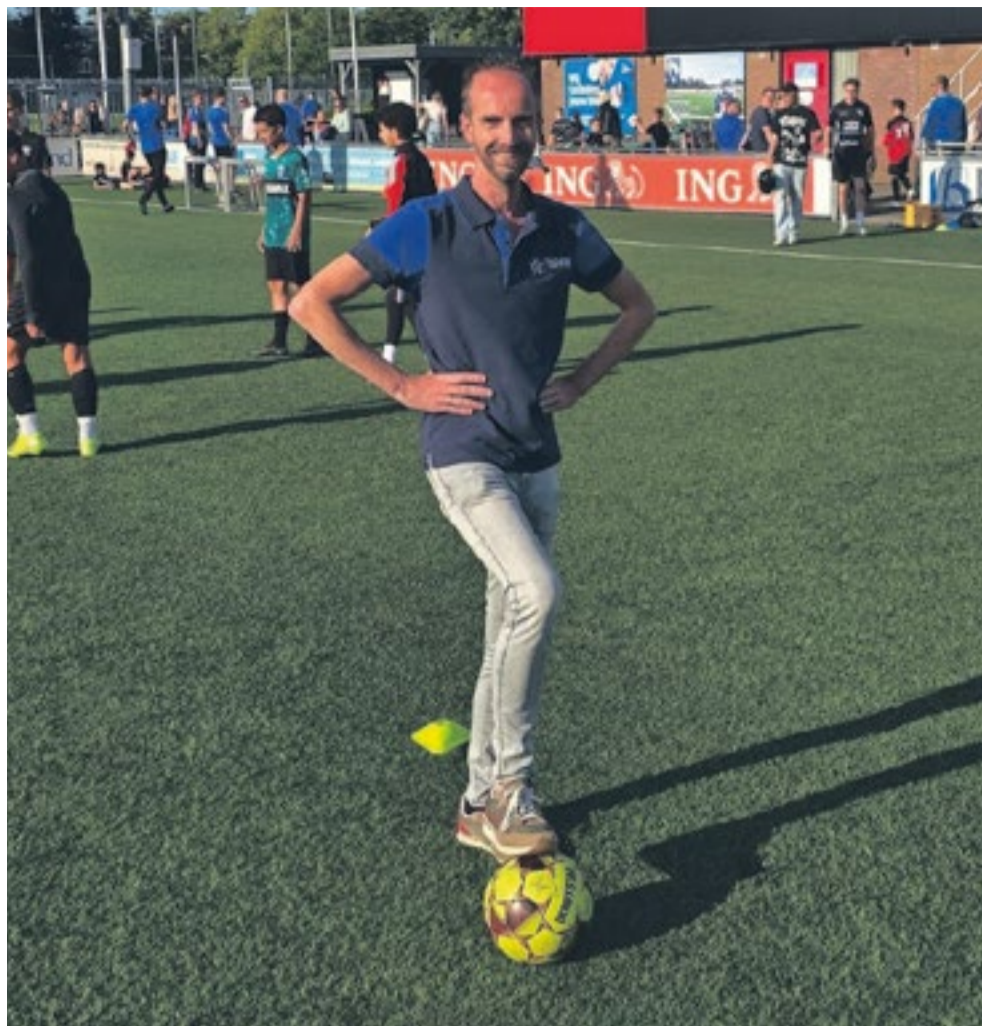
Het coachen van de jonge spelertjes is heel leuk, geeft ook ontspanning en voldoening