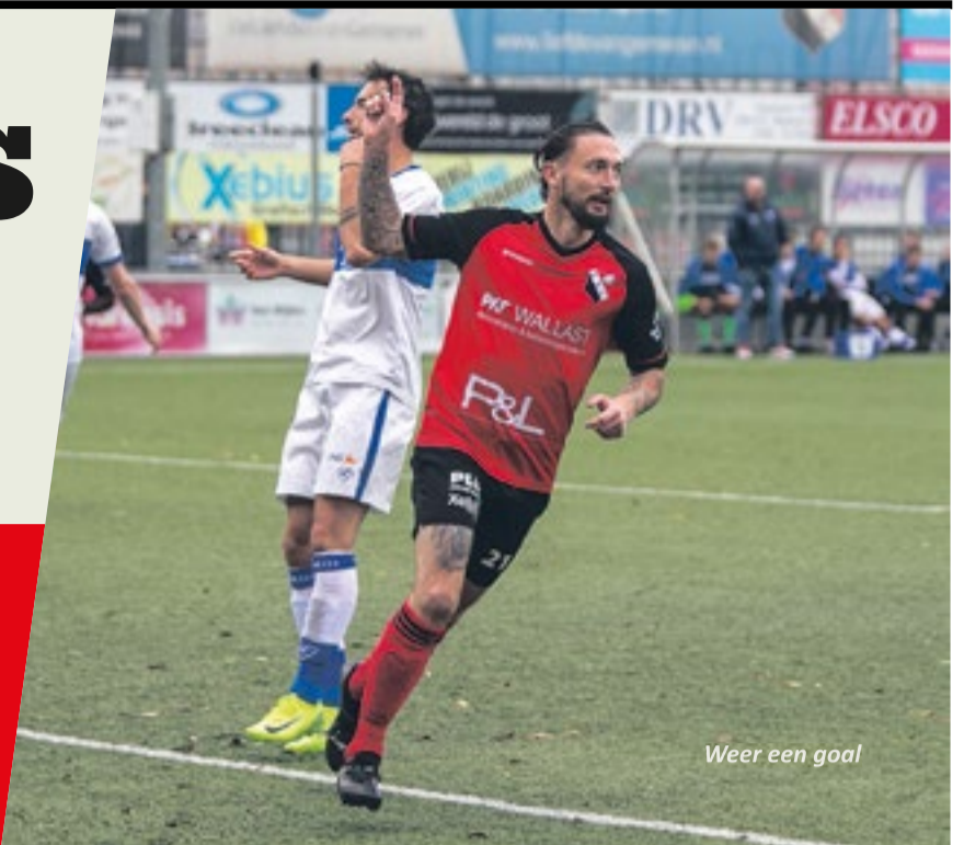
Weer een goal