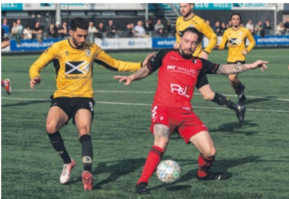
Kenmerkende kracht, controle en focus

Zonder aarzeling: “Een goal natuurlijk!” Om te vervolgen: “Maar de laatste jaren was mijn rol wel iets anders. Ik was vaker een aanspeelpunt, waardoor ik ook wel eens de steekpass gaf. Hierdoor was ik ook belangrijk voor het team wanneer ik niet scoorde. Maar het gevoel na een goal - juichen, soms geforceerd, en het team dat naar je toekomt - dat gaat nooit vervelen.”