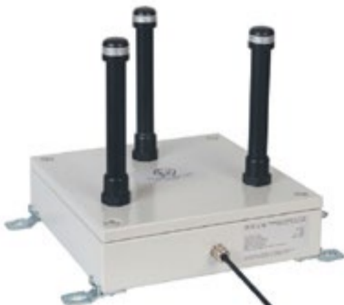
ATEX Wireless Networks