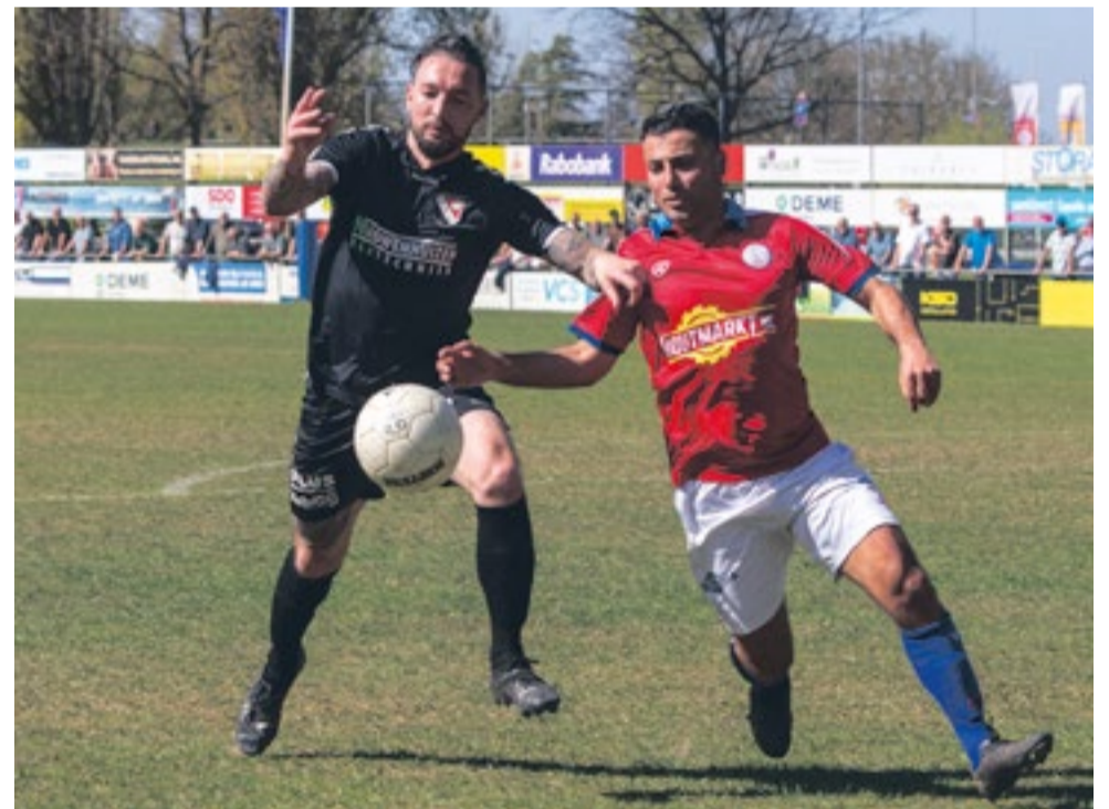
4x scoren in kampioenswedstrijd tegen VVGZ

“Van de 200 in dienst van IFC kwamen ze in alle vormen voorbij: omhaal, binnen en buiten de 'zestien', laag of in de kruising en zelfs vanaf eigen helft. Ik zou echter geen specifieke kunnen noemen, anderen moeten dat maar zeggen. Wel was het zo dat koppen nooit mijn sterkste punt was. En hoewel ik rechtsbenig ben, heb ik er ook genoeg met links gescoord.”