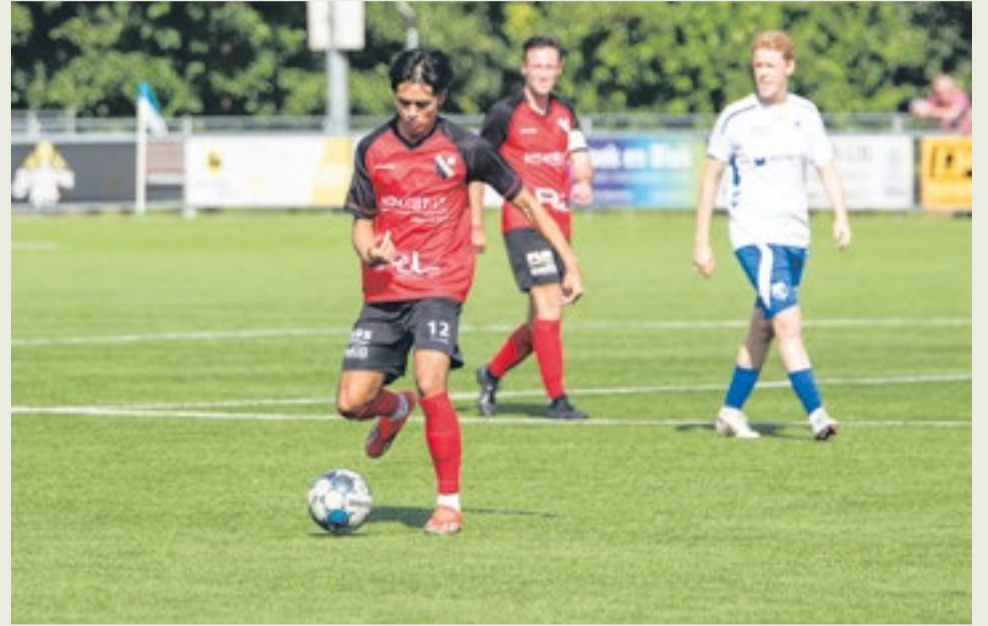
Sierlijke, talentvolle speler met doorbraak in dit seizoen.

Dit seizoen: In 80% van de wedstrijden heb ik minuten gemaakt, meestal als invaller, maar ook een aantal in de basis. De beste wedstrijd was thuis tegen RVVH, waarin ik als basisspeler twee keer scoorde. Mijn enige doelpunten