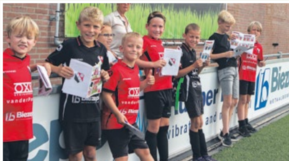
Handtekeningen jagen tijdens de open dag van IFC

Met heel veel dank aan al die vrijwilligers!