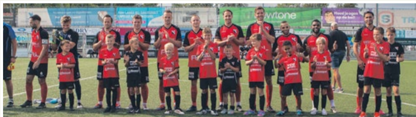
Team van de week bij het 1e elftal