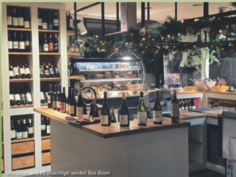
Wijnproeverij bij prachtige winkel Bas Baan